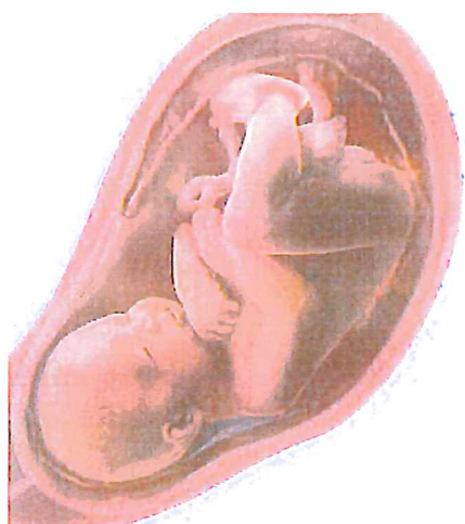
Miminko v děloze

ze kterého se během _____ měsíců vyvíjí _____.