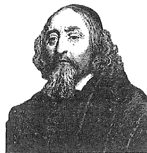
Jan Amos Komenský (portrét od rytce Václava Hollara)

Dodnes se ve školách na celém světě učí podle jeho názorů. Proto bývá Komenský často nazýván „ učitelem národů “