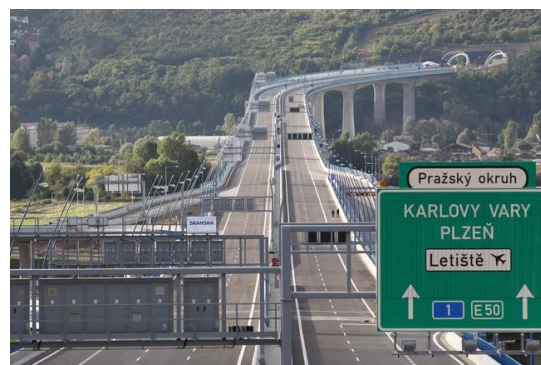
silniční obchvat Prahy – Pražský okruh