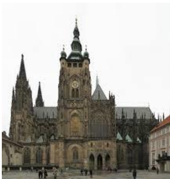
Chrám sv. Víta na Pražském hradě