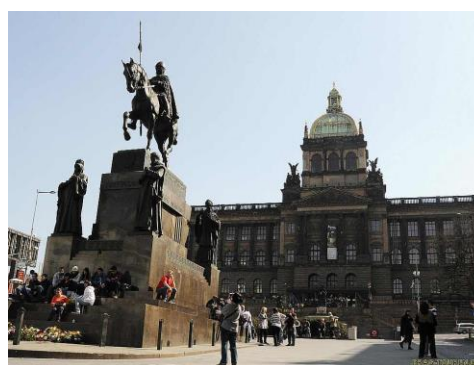
Socha sv. Václava na Václavském náměstí