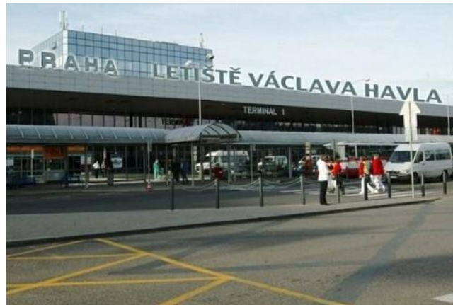
Letiště Václava Havla